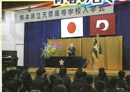
緊張の面持ちの新入生