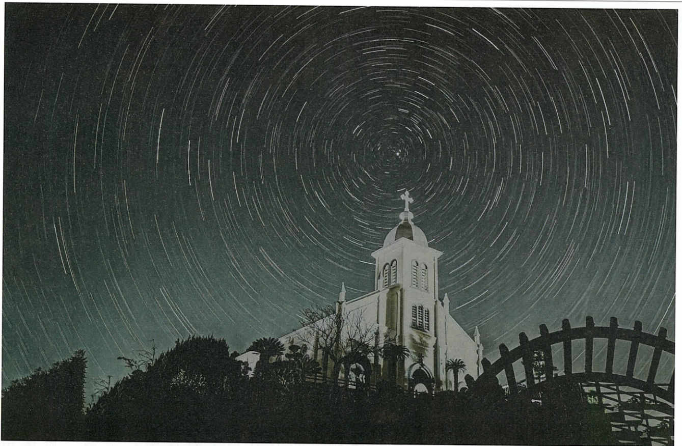
大江教会のクルスの上に北極星を置きレンズを60分開放にして星の軌跡を撮影。 北極星を中心にして15度回転、遠くに離れるほど長く動いているのが分かる。