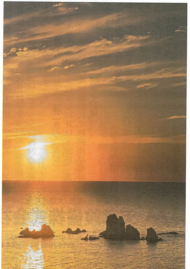
天草の風景と言えば西海岸の夕陽でしょう。なかでも東シナ海に沈む大ヶ瀬の夕陽は格別のものがある。西平橋公園から撮影した1枚。(天草町大江)