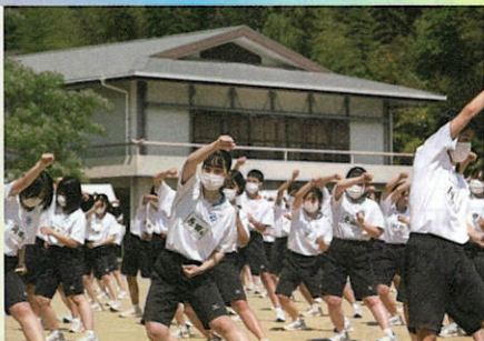
伝統の集団演技「天高体操」