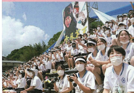
演技者に声援を送るスタンド席