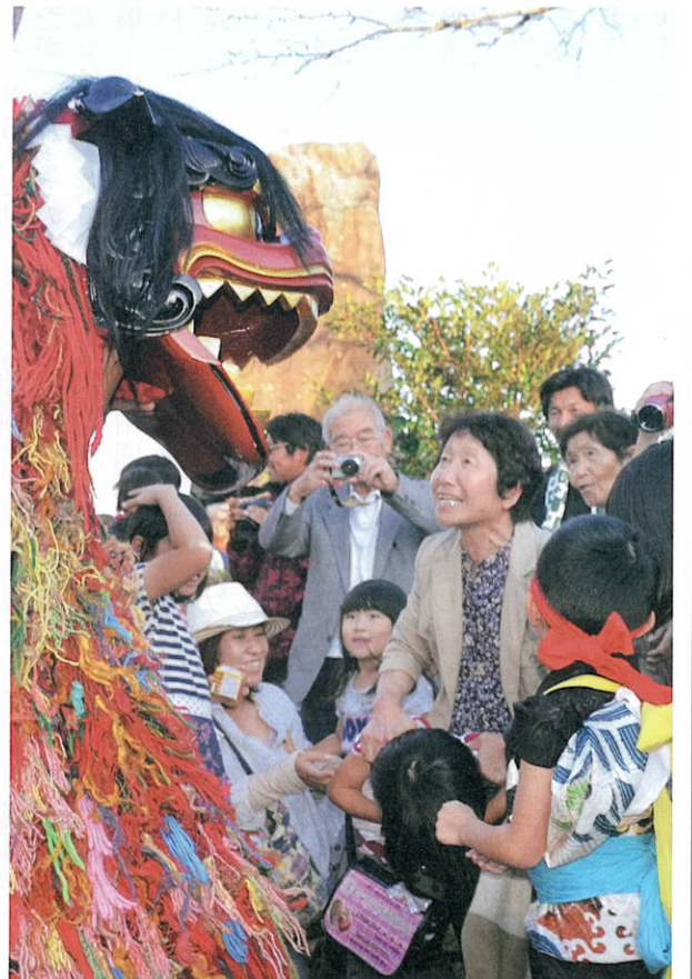
樹齢400年の大楠がある大宮地八幡宮。毎年10月の例大祭では、3基の神輿を奉じ、神幸行列・鳥毛振り・獅子舞が奉納される。(新和町)