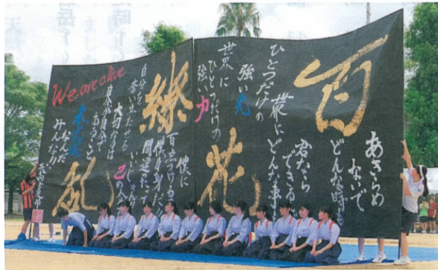
書道部、雛鵬祭でのパフォーマンス

令和3年10月16日(土)開催予定の同窓会ゴルフ大会は、大同窓会との絡み、理事会での決定を受けて、本年度は中止いたしました。