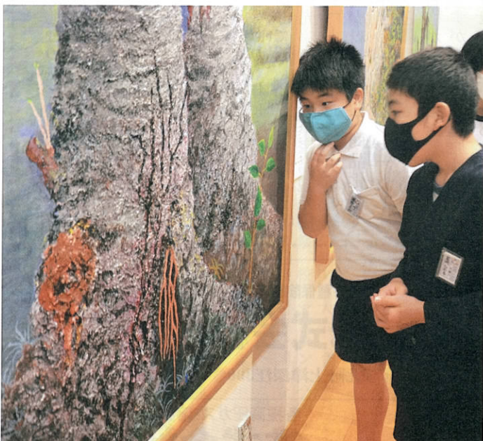
『ふるさと、天草に帰る一菊池恵楓園絵画クラブ金陽会作品展』には、多くの小中学・高校生が訪れた。天草の魅力と人間の強さに触れた。(苓北町)