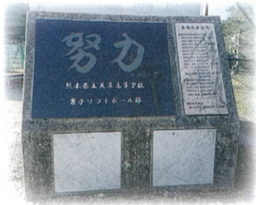
第2グラウンドバックネット付近

また、2年生から国民体育大会少年男子の選手として、兵庫県で開催された国民体育大会に出場できました。石碑に刻まれている『努力』をすること、続けることを意識して生活をしてきました。部活動を通して、多くのことを学びました。自分の目標に向けて、努力すれば結果が出ます。自分が行動した分だけ結果が出ます。恩師に言われた言葉があります。『人は、過去を振り返ることができるが、戻ることはいけません。しかし、未来は変えることができる。それは、他人がしてくれているのではなく自分自身で切り拓いていくしかない』