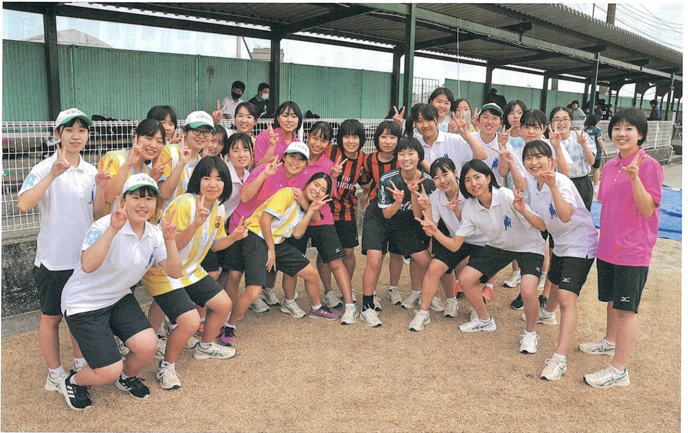
天高のマラソン大会は、昭和5年、6月10日の『時の記念日』に始まった。88回目の今年は、新型コロナウイルス感染防止対策をとり、長距離走記録会として開催。小雪がちらつく大寒の2日間、全員が元気に完走した。