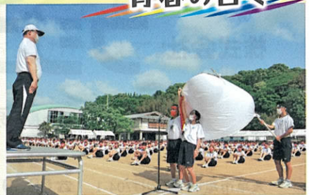
目に鮮やかな新緑の5月、2年振りの体育大会。テーマは「煌華~青春のはなひらり~」。コロナ禍をはねのけて、一人一人が煌めき未来に飛翔する催しとなった。